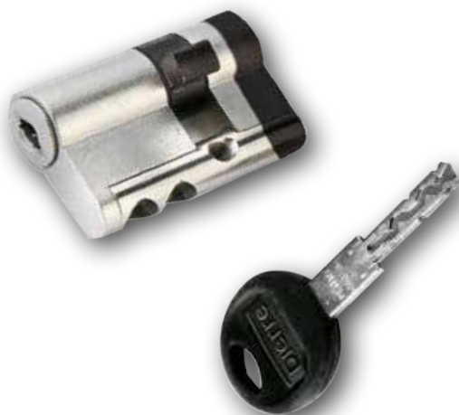
Chiave standard Standard key